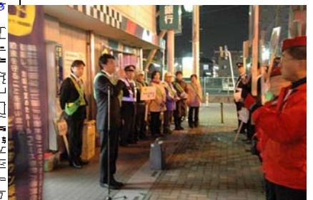
昨年末の合同パトロールの様子