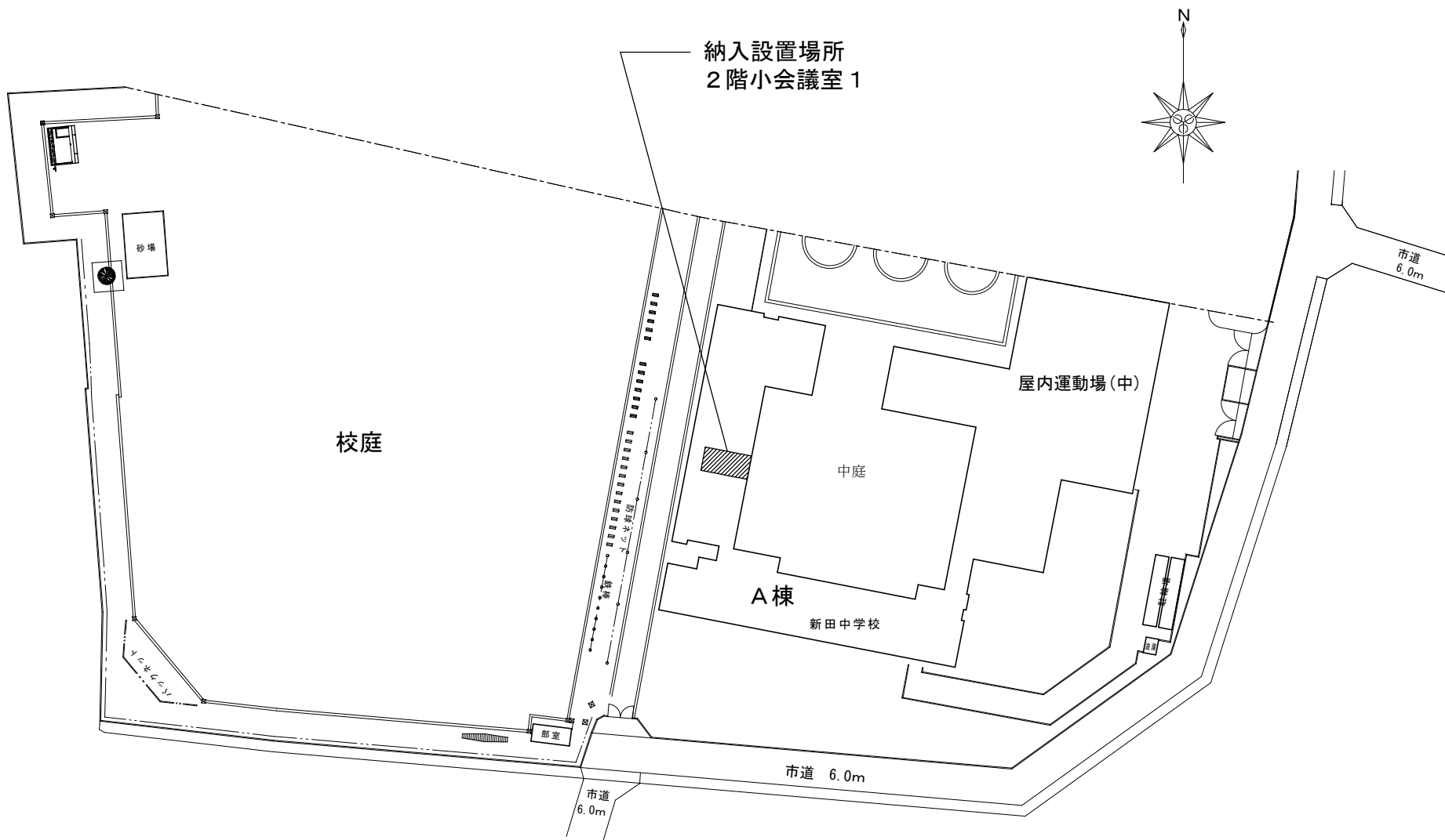
新田中学校配置図 1/1000