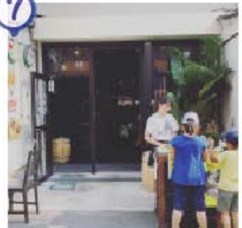
FUN-KEY SOKA SOKO Grill&Bar