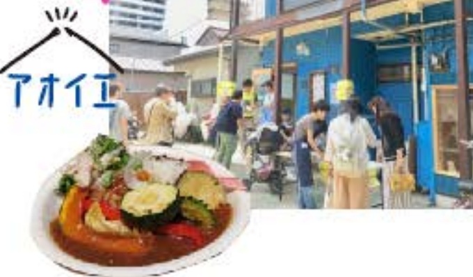
キッチンスタジオ アオイエ