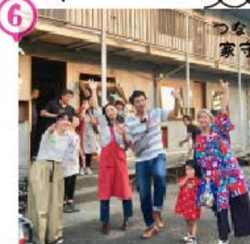
シェアアトリエ つなぐば