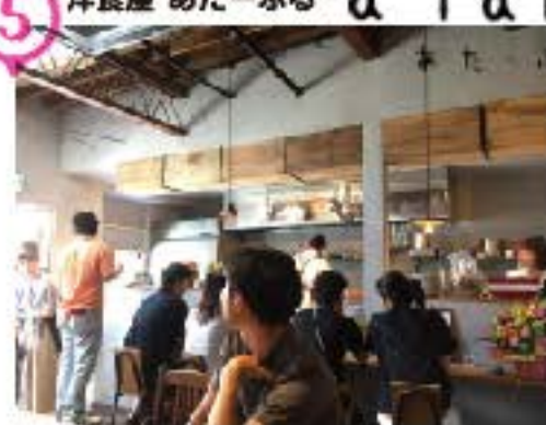
洋食屋 あたーぶる a Table