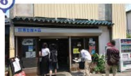
よろずキッチン恵登屋